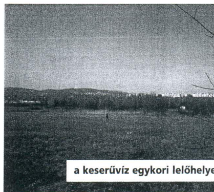
a keserűvíz egykori lelőhelye