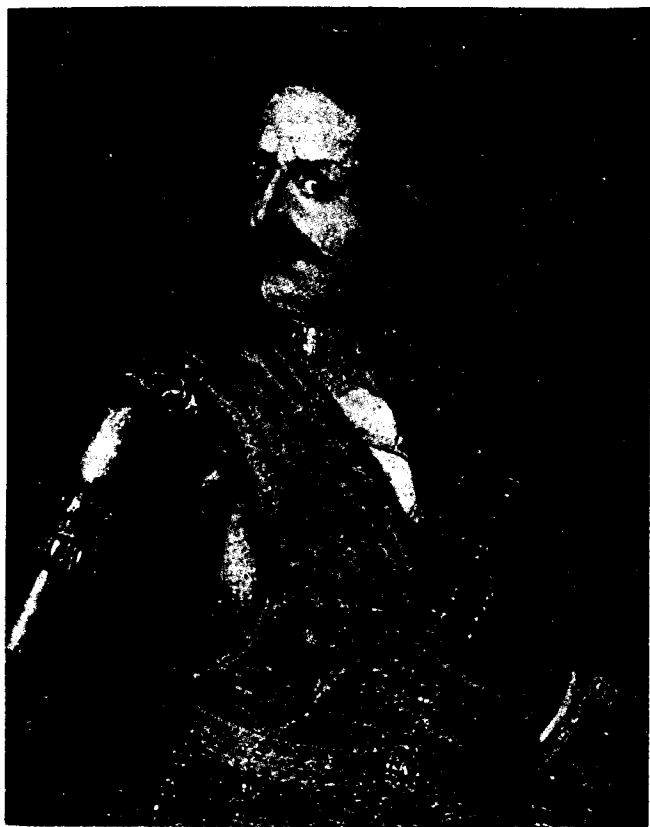
Bercsényi Miklós portréja. Ismeretlen művész festménye a XVIII. század elejéről, Magyar Nemzeti Múzeum

ne bocsássanak magyar kézre Ujvárat... Azonban recommendálom [ajánlom] Kegyelmednek az mi embe- reinket, kérem, táplálja mind segítséggel, mind taná- csával.” – kérte cseszneki Esterházy János gróf, győri vicegenerálist. Ilyen szemlélet alapján nem meglepő, hogy Anton Caraffa generális 1687-es vérengzését kö- vetően a tizenhárom északkeleti vármegye küldöttségé- nek tagjaként idősebb Bercsényi Miklós azok között volt, akik Bécsben tiltakoztak az olasz származású csá-