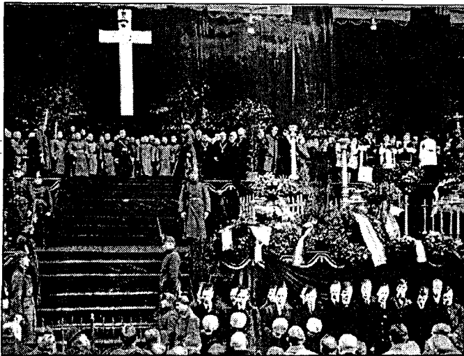
A budaörsi csata hőseinek ravatala a Nemzeti Múzeumnál. Mindkét kép a Nemzeti Múzeum gyűjteményéből származik. Külön érdekességük, hogy eddig egyiket sem publikálták

A világháború és a forradalmak, a megszállások után - a belső nyugalom és az összefogás helyett - magyar