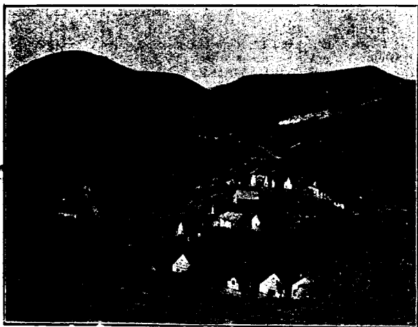
Részlet a Budaörsi hegyekből.

A Strassberg (264 m.), a Luckenbergtól Ny-ra emelkedő alacsonyabb, kevésbé sziklás hegy, közvetlenül az országút mentén. A falu Ny-i végén levő korcsmánál nyíló völgybe fordulva, ÉNy-i irányban vezető úton felszállunk a rétekig, melyekről b. felé kis ösvény visz a csúcsra. A kilátás a Csiki-hegyekre igen szép. Az említett korcsmától a csúcsra 20 perc.